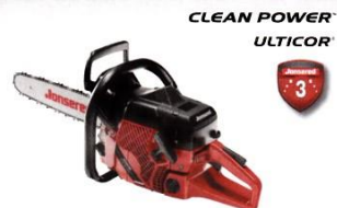
CS2166 70.7 cm 3 - 4.8 hp - 14.1 lb (6.4 kg) Pas de chaîne de 3/8"