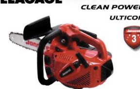
CS2236T-14 35.2 cm 3 - 2hp - 7.5 lb (3.4 kg) Pas de chaîne: 3/8"