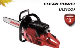
CS2172 70.7 cm 3 - 5.5 hp - 14.1 lb (6.4 kg) Pas de chaîne de 3/8"