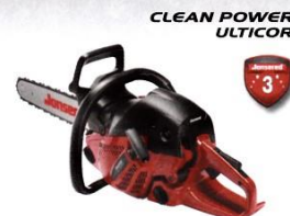
CS2258 59.8 cm 3 - 4.2 hp - 12.35 lb (5.6 kg) Pas de chaîne de 3/8"