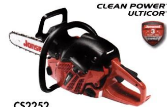
CS2252 50.1 cm 3 - 3.4 hp - 11.02 lb (5.0 kg) Pas de chaîne .325"