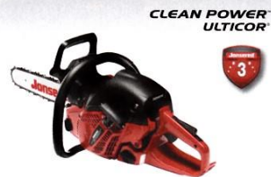
CS2253 50.1 cm 3 - 3.8 hp - 11.02 lb (5 kg) Pas de chaîne .325"