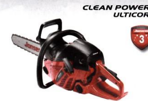
CS2260 59.8 cm 3 - 4.7 hp - 12.35 lb (5.6 kg) Pas de chaîne de 3/8"